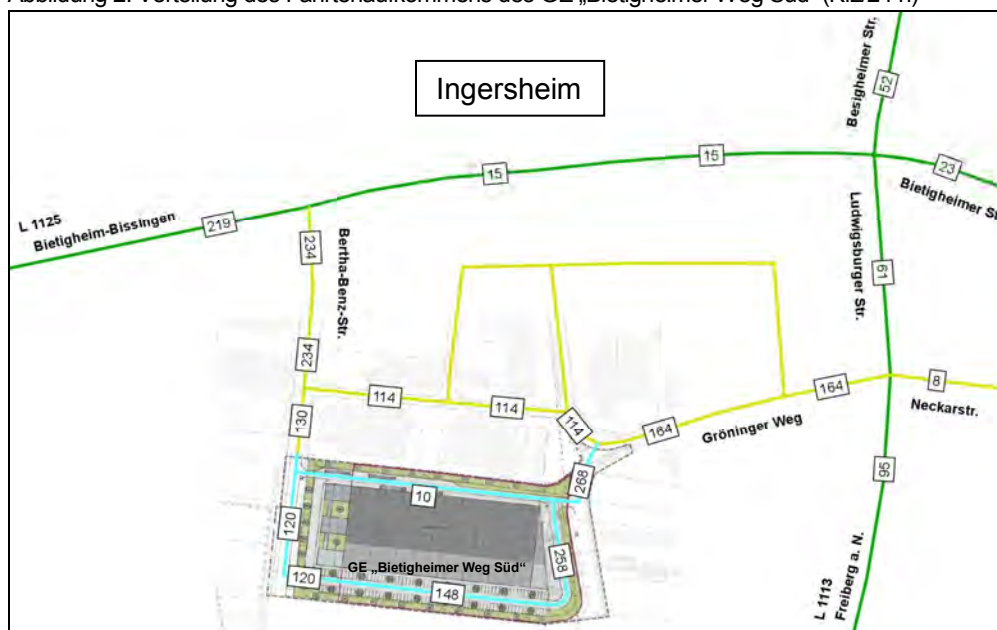
Abbildung 2: Verteilung des Fahrtenaufkommens des GE „Bietigheimer Weg Süd“ (Kfz/24 h)

Knapp 59 % des gesamten Fahrtenaufkommens aus dem geplanten Gewerbegebiet „Bietigheimer Weg Süd“ fahren über den Anschluss L 1125/Bertha-Benz-Straße, während ca. 41 % des Fahrtenaufkommens über den Gröninger Weg zur Ludwigsburger Straße (L 1113) und zur Neckarstraße orientiert sind.