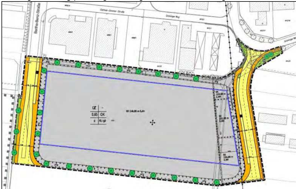
Abbildung 1: Bebauungsplan „Bietigheimer Weg Süd, 1. Bauabschnitt“ in Ingersheim