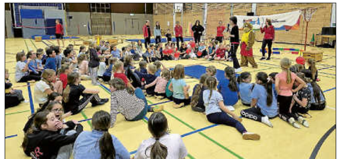
Zahlreiche Kinder beim Tag des Kinderturnens

Am 7. November 2025 fand der Tag des Kinderturnens unter dem Motto „Tierische Turn-Weltreise“ in der Fischerwörthhalle statt. Pünktlich um 14.30 Uhr starteten alle vier Eltern-Kind-Gruppen mit der ersten Turnrunde. Ob fliegen wie ein Flughörnchen, springen wie ein Frosch, klettern wie ein Affe, rollen wie ein Gürteltier oder sich einfach entspannt schaukeln wie ein Faultier. Für jedes Kind war etwas dabei. Ein besonderer Stargast hatte sich auch unter die Kinder gemischt: Taffi, der Turnaffe vom Deutschen Turner-Bund, überraschte die Kinder mit seinem Besuch. In der Pause zeigten die Tanzmäuse und die Dancing Kids, was sie in den vergangenen Monaten einstudiert hatten. Danach ging es dann auch schon mit den sieben Vorschul- und Schulgruppen weiter. Am Ende eines jeden Durchgangs fand eine Siegerehrung statt und die Kinder konnten stolz und glücklich mit einer Urkunde und einem kleinen Geschenk nach Hause gehen. Die Halle war den ganzen Nachmittag über mit mehr als 100 Teilnehmern aus allen Bereichen des Kinderturnens gefüllt. Der Spaß an der Bewegung spiegelte sich in den vielen leuchtenden Kinderaugen wieder. Der Wirtschaftsausschuss unterstützte uns mit dem Verkauf von Getränken, leckeren Kuchen, frisch gebackenen Waffeln und Brezeln. Vielen Dank für euren Einsatz! Auch ein Dankeschön an das Orga-Team vom Tag des Kinderturnens und an die Eltern für die Kuchenspenden. ~E. Brückle