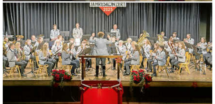
Jugendorchester (oben) und Blasorchester (unten)