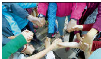
Zusammen was bewegen

5. Juli 2026 Siegerehrung beim Dorffest in Kleiningersheim