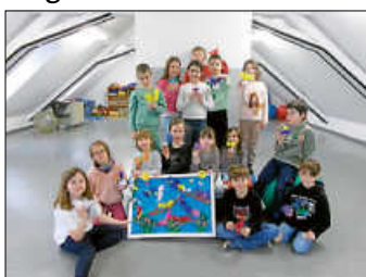
Es macht Piep!

Im Dachgeschoss machte es „Piep!“. Aus bunten Holzklammern, mit Farbe, Papier und Federn geschmückt, entstanden viele bunte und witzige Piepmätze . Sie fanden einen schönen Platz auf einem großen Bild.