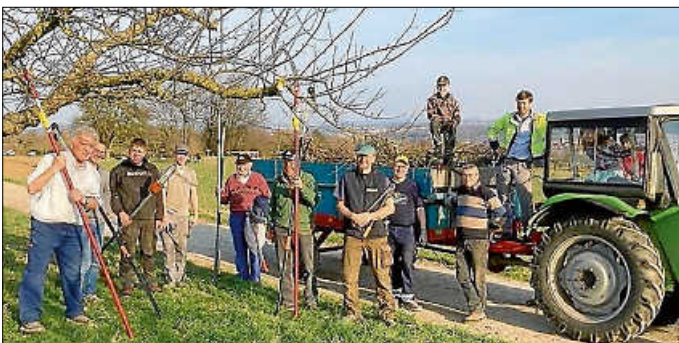
Ja, uns Spaß macht es auch noch :-)

Der Obst- und Gartenbauverein Großingersheim lädt alle Bürgerinnen und Bürger herzlich ein, am Samstag, den 21. März 2026 , sich gemeinsam für unsere Landschaft einzusetzen teilzunehmen. Auch Ungeübte sind herzlich willkommen und erhalten fachkundige Anleitung und Unterstützung.