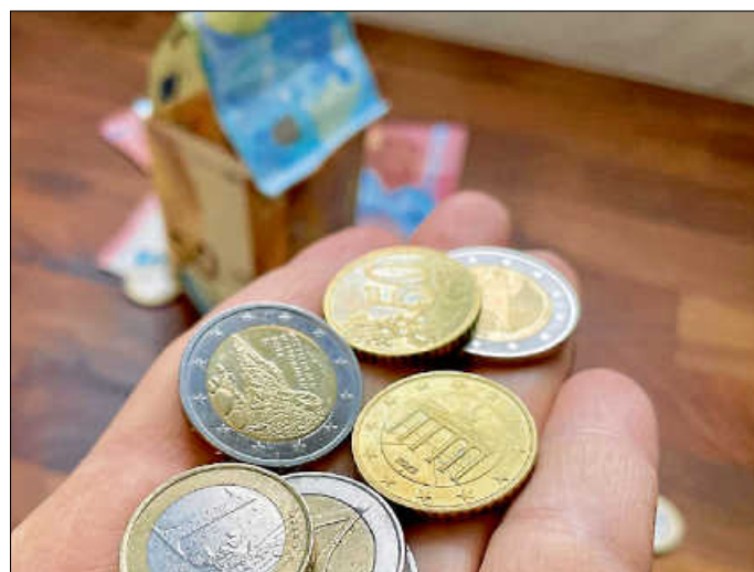
Bei vorausschauender Planung kann mit flexiblen Strompreisen bares Geld gespart werden

Aufgrund der Komplexität sind flexible Stromtarife nicht uneingeschränkt empfehlenswert. Bei moderatem Stromverbrauch, dem Wunsch nach Planbarkeit oder rascher, technischer Überforderung, sorgt ein Festpreistarif für mehr Freude und meist geringere Kosten. Bei Fragen rund um den eigenen Energieverbrauch, können Sie unter 07141 68893-0 einen kostenlosen Beratungstermin vereinbaren.