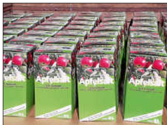
Apfelsaftaktion Flur und Verkehr