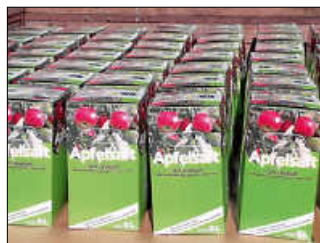
Apfelsaftaktion Flur und Verkehr