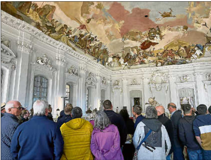
Führung in der Residenz Würzburg

der Stadt ein Eis zu holen, was bei der langen Warteschlange recht herausfordernd war.