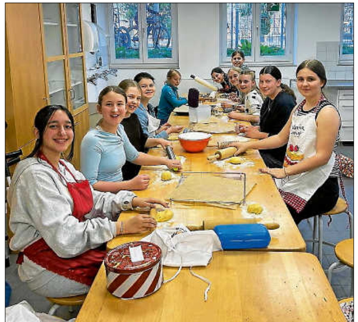
Am Freitag, den 20.03.2026, erlebten 24 Kinder und drei