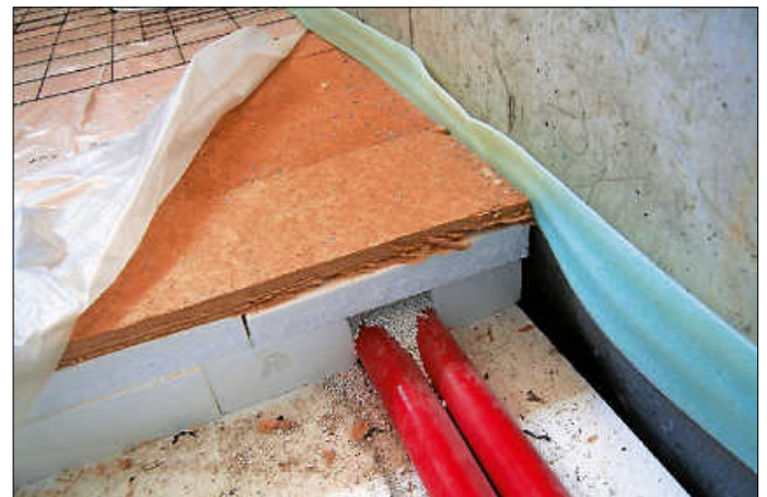
Praktische Schüttdämmung für Rohrleitungen | KEA