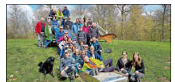
Angenehmes Wanderwetter für die Gruppe

Eine Wandergruppe des TVI (bestehend aus 34 Zweibeinern und einem Vierbeiner) traf sich am 03.04. zur jährlichen Frühjahrswanderung. Treffpunkt war dieses Mal am Schützenhaus in