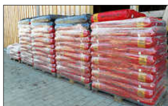
Erde wartet auf ihre Abholung

Die bestellten Erden sind da. Am Samstag den 11. April 2026 in der Zeit von 11.30 Uhr bis 13.30 Uhr können sie auf dem Lindenhof abgeholt werden.