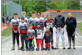
Race-Team MSC Ingersheim

Im zweiten Vorlauf stürzte er leider bei einem Überholmanöver in der ersten Kurve und konnte nicht weiterfahren.