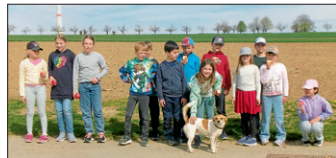
Viel Spaß auf dem Holderhof

Der Donnerstag führte die Kinder zur Wanderung auf den Holderhof . Viel Spaß hatten die Kinder beim Trampolinspringen, Klettern, schaukeln und mit den Fahrzeugen Herumdüsen. Nebenher knabberten sie knackige Äpfel und fütterten auch noch die Ziegen und Schafe.