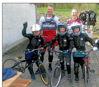
Tolles Erlebnisfahrten auf der BMX Bahn