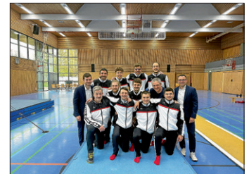
Die Mannschaft mit Trainer und Karis

Am Sonntag (12. April) empfing die TG Ingersheim-Sersheim in der heimischen Sport- und Kulturhalle den ungeschlagenen Tabellenführer der Landesliga Staffel, den MTV Stuttgart. Trotz einer engagierten Leistung mussten sich die Turner der TG