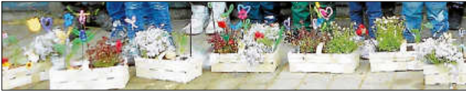
Gemeinsame Aktion von 2025

Beim Kleiningersheimer Dorffest Siegerehrung „Wer hat in 10 Wochen die schönste Pflanze“ Festplatz beim Vereinsheim „Schönblick“