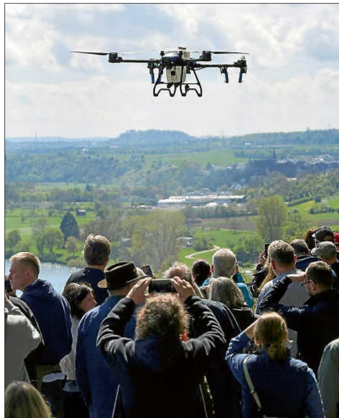
Erster Flug über den Weinbergen

Ansprechpartner für die Anschaffung und den Service gefunden werden. Mit einer Gratis- Seccorunde wurde gemeinsam auf die neue Pflanzenschutzzära in Ingersheim angestoßen.