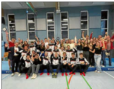
Die TG mit den vielen mitgereisten Fans

Den Sprung (42,20 : 44,35) und damit endgültig den Wettkampfsieg sicherte sich dann schließlich der TSV Böbingen. Auch wenn die TG und die mitgereisten Fans nicht jede Wertung nachvollziehen konnten, kannte die Turngemeinschaft an, dass die Böbinger an diesem Tag das bessere Team waren – das man gerne in einem engeren Wettkampf