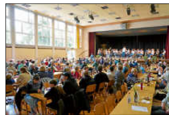
Tag der Blasmusik in der SKV-Halle

Den Auftakt gestalteten ab 11.00 Uhr die Ingersheimer Youngsters sowie das Jugendblasorchester Ingersheim. Im weiteren Verlauf sorgten der Musikverein Löchgau, der Musikverein Kleiningersheim und abschließend der Musikverein Bissingen für ein vielfältiges Blasmusikprogramm bis in den Abend hinein. Auch für das leibliche Wohl war bestens gesorgt. Angeboten wurden unter anderem Rotwurst, Currywurst, Pommes, Fleischbrot sowie Crêpes. Die Jugendabteilung bewirtete die Gäste zusätzlich mit Kaffee und Kuchen. Für Kinder gab es ein eigenes Unterhaltungsangebot mit Kinderschminken, Glitzertattoos und Dosenwerfen. Das Blasorchester Ingersheim e.V. freute sich über einen schönen Tag und bedankt sich bei allen Besucherinnen und Besuchern sowie allen helfenden Händen!