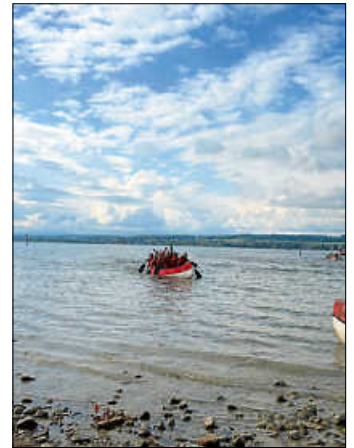
Paddeln beim DBW

Der DBW fand aufgrund der niedrigen Temperaturen des Bodensees diesmal ohne Schwimmen statt. Drei 8-10er Teams versuchten beim Paddeln auf dem Bodensee und dem anschließenden Lauf am „Hörnle“ ihr Glück. Das Ergebnis: 6., 38. und 112. Platz bei über 200 Mannschaften teilnehmenden Teams.