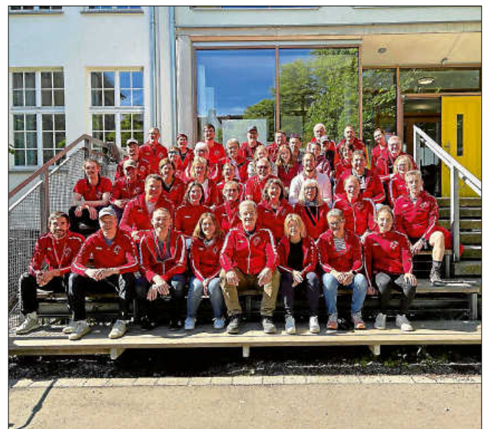
Alle TVI'ler auf dem Turnfest

Alles in allem war es ein sehr angenehmes und gut organisiertes Turnfest mit vielen Geschichten, die nur das Turnfest schreibt. Viel Sport, zahlreiche Eindrücke, viele alte und neue Bekannte, einige Partys und kurze Nächte - all das macht ein Turnfest aus. So auch das Diesjährige, das für die Ingersheimer am Sonntag nach der Abschlussveranstaltung am Mittag mit der Heimfahrt endete.