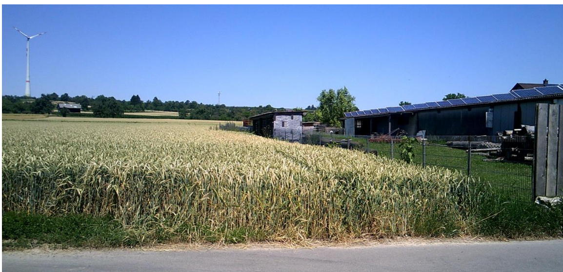
Abbildung 9 Ausgleichsfläche von Süden