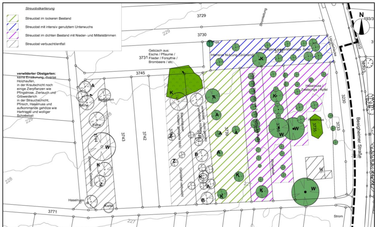
Abbildung 1 Streuobstkartierung und Bestandsbeschreibung

Innerhalb des Plangebiets kommen verschiedene Ausprägungen von Streuobst vor: