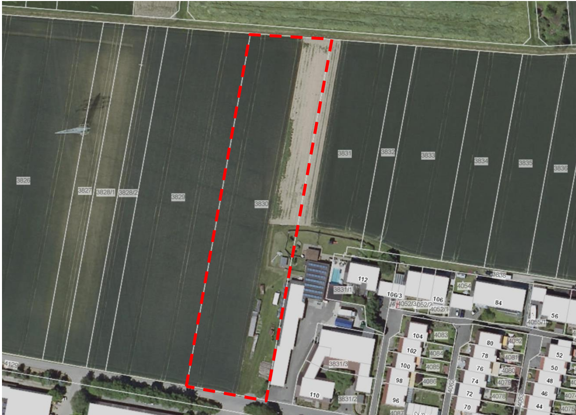
Abbildung 8 Ausgleichsflächen für Ersatzpflanzung - Flst. 3830

Die Fläche wird zum größten Teil als Acker bewirtschaftet. Im Süden werden die Flächen teilweise als Weide genutzt.