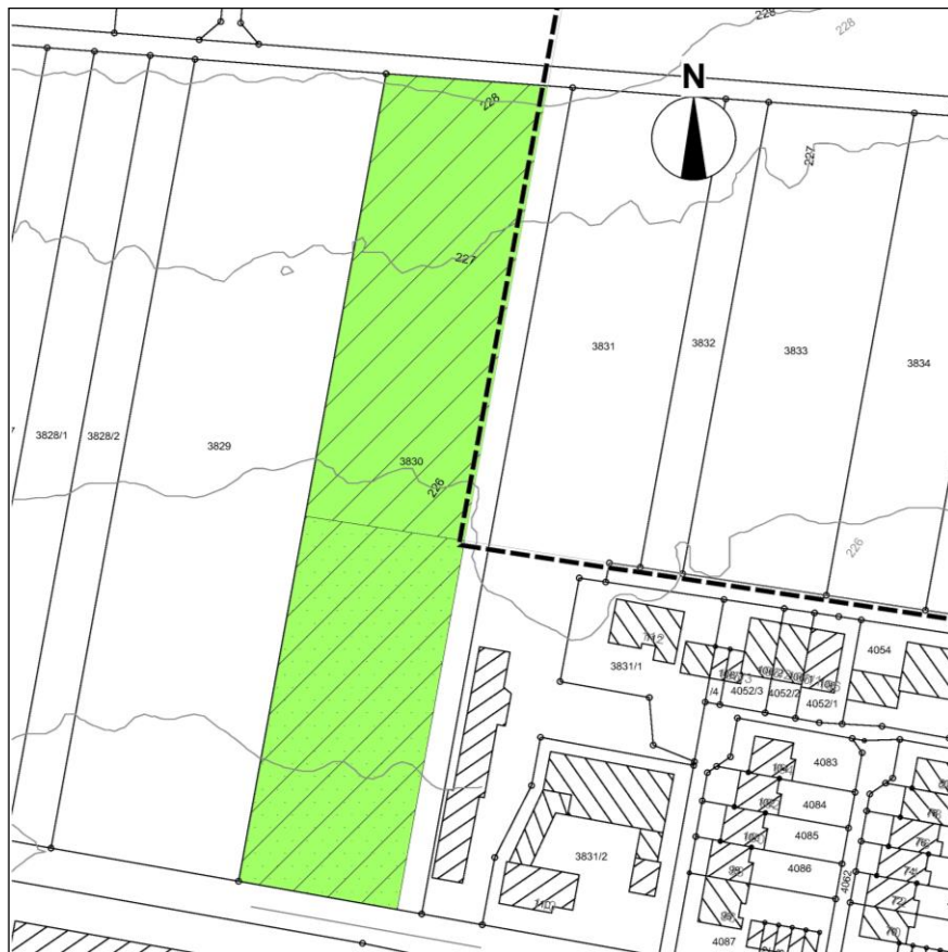
Abbildung 10 Umsetzung Ausgleich

Für die Bäume werden hochstämmige Obstbäume in einem Abstand von 10 bis 12 m gepflanzt. Bei einer Beweidung sind die Bäume vor Verbiss zu schützen.