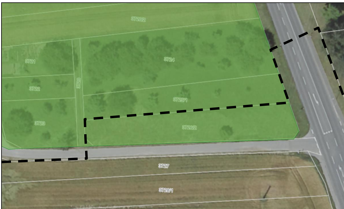
Abbildung 2 Lage des LSG im Plangebiet

Der Geltungsbereich des Bebauungsplans „In den Beeten II“ ragt im Norden in das Landschaftsschutzgebiet „Enztal zwischen Bietigheim und Besigheim mit Rossert, Brachberg, Abendberg und Hirschberg sowie Galgenfeld, Forst und Brandholz mit Umgebung“ hinein. Der Geltungsbereich beinhaltet das Flst. 3726/2 und eine Ecke des Feldwegs auf Flst. 3720. Der Feldweg ist als Grasweg ausgebildet. Auf dem Flst. 3726/2 besteht eine gewöhnliche Fettwiese mit üblicher Artenausstattung. Die Wiese wird durch einen einzelnen mittelstämmigen Birnenbaum bestanden. Der Baum besitzt eine besondere Habitategnung durch Baumhöhlen.