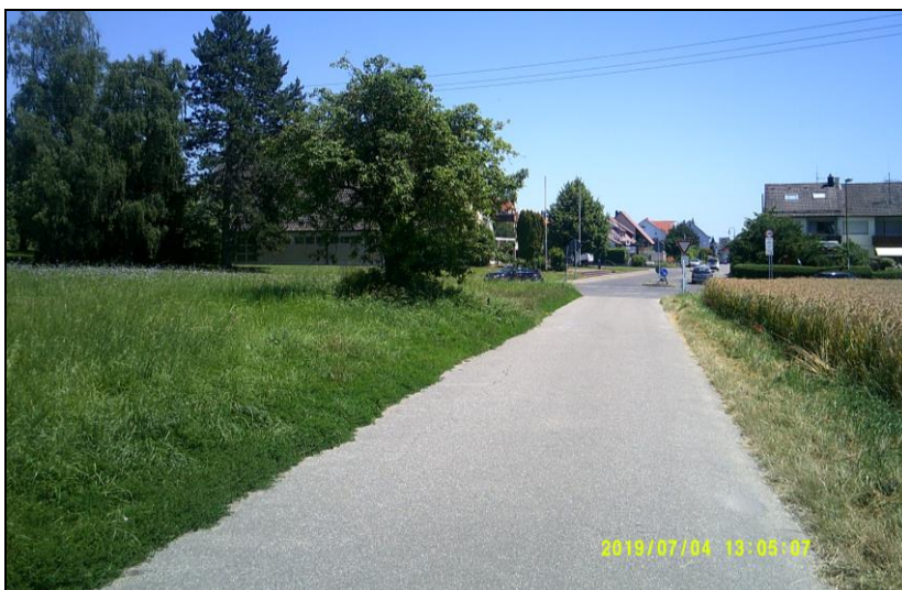
Abbildung 3 Foto der Wiese mit Baum